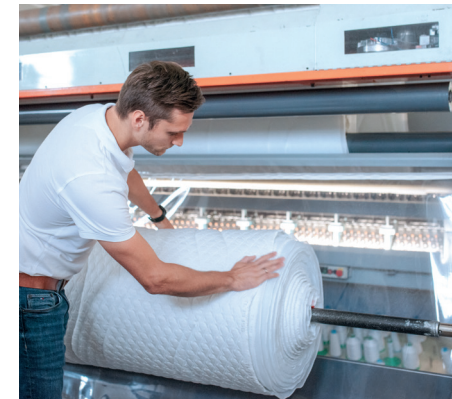
Bereits der Bezugsstoff ist revolutionär – Hightech-Fasern sorgen für eine antibakterielle Wirkung gegen Schweiß, schützen vor Milbenbefall und reduzieren die elektrische Spannung des Körpers.