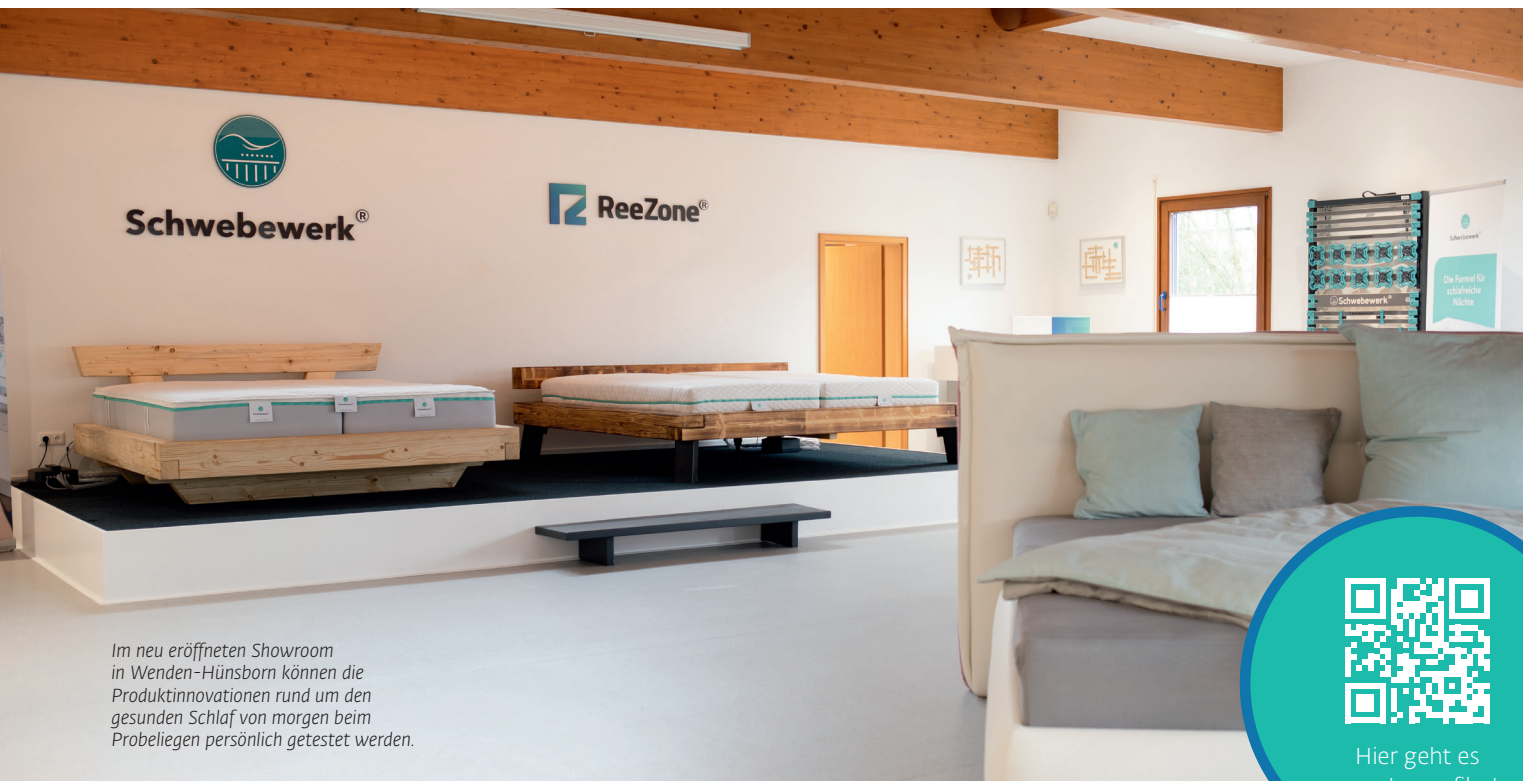
Im neu eröffneten Showroom in Wenden-Hünsborn können die Produktinnovationen rund um den gesunden Schlaf von morgen beim Probeliegen persönlich getestet werden.