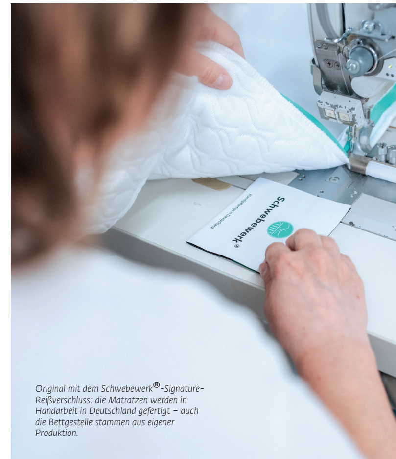
Original mit dem Schwebewerk®-Signature-Reißverschluss: die Matratzen werden in Handarbeit in Deutschland gefertigt – auch die Bettgestelle stammen aus eigener Produktion.