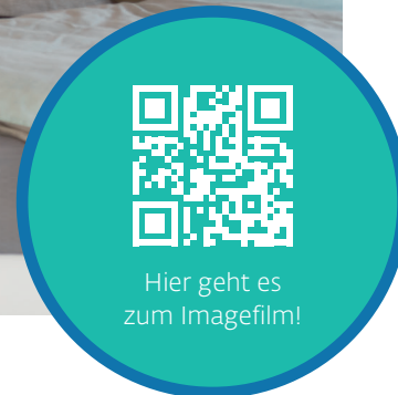
Hier geht es zum Imagefilm!

„Unser Ziel ist, die beste Schlaflösung für jeden zu finden. Denn wie wir in der Nacht liegen und wie viele Milben unseren Schlaf begleiten, hat großen Einfluss auf unsere Lebensqualität.“